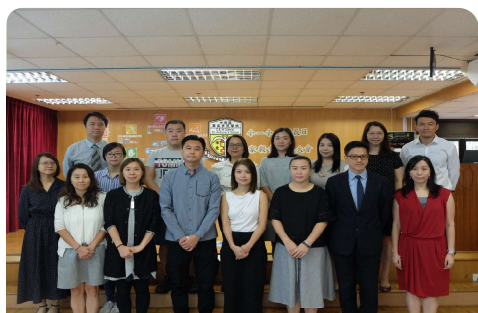
中西區聖安多尼學校

學校類型: 資助中學 (男校) 創立年份: 1953年 學校地址: 九龍天光道16號