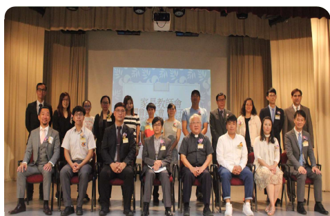
天主教慈幼會伍少梅中學

學校類型: 資助中學 (男校) 創立年份: 1965年 學校地址: 香港堅尼地道25-27號