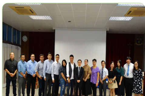
香港聖類斯中學 (小學部)

學校類型: 私立小學 (男校) 創立年份: 1927年 學校地址: 西營盤第三街179號