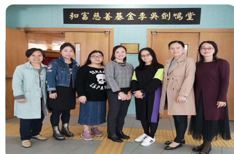
慈幼葉漢千禧小學

學校類型: 資助小學 (男女校) 創立年份: 1993年 學校地址: 葵涌安蔭邨